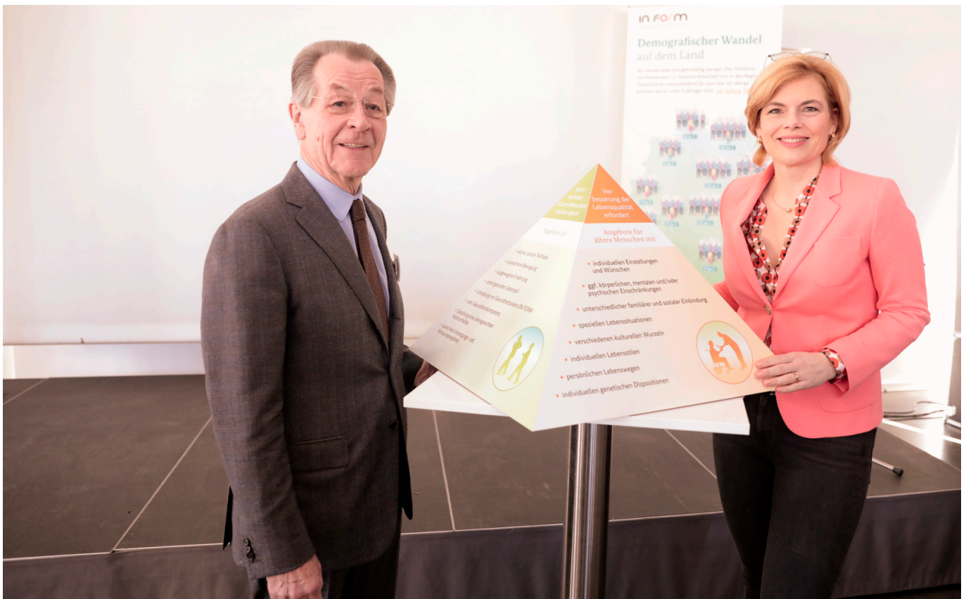
Bundesernährungsministerin Julia Klöckner und der BAGSO-Vorsitzende, Franz Müntefering, auf der Fachtagung in Bonn. Die Veranstaltung der BAGSO ist Teil des vom Bundesministerium für Ernährung und Landwirtschaft (BMEL) geförderten Projektes "Im Alter IN FORM - Gesunde Ernährung, mehr Bewegung, aktive Teilnahme in Kommunen fördern".

Die Bundesministerin für Ernährung und Landwirtschaft, Julia Klöckner, eröffnete Ende Februar 2019 gemeinsam mit dem Vorsitzenden der Bundesarbeitsgemeinschaft der Seniorenorganisationen (BAGSO), Franz Müntefering, die Auftaktveranstaltung der BAGSO zum Thema "Die Gesundheit älterer Menschen in Kommunen kreativ gestalten - genussvoll essen, Körper und Geist bewegen, Gemeinschaft und Freude erleben".