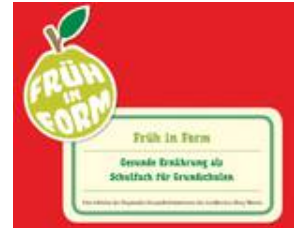
Bild: Früh in Form - Gesunde Ernährung als Schulfach für Grundschulen