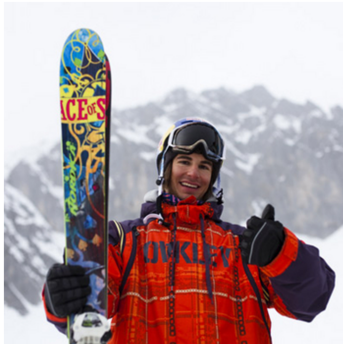
Bereit für den nächsten Wettkampf.

Leidenschaft, Ehrgeiz und Mut - das sind die Voraussetzungen, um den Extremsport Freeskiing zu betreiben.